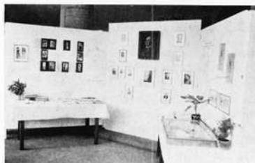
Abteilung: Historischer Verein Schweinfurt e. V.

Dezember 1959: Ausstellung des Historischen Vereins Schweinfurt e. V.: „Aus der Arbeit der fränkischen Geschichtsvereine“