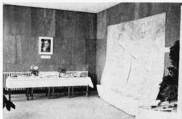
Abteilung: Frankenbund zur Kenntnis u. Pflege des fränkischen Landes und Volkes e. V.