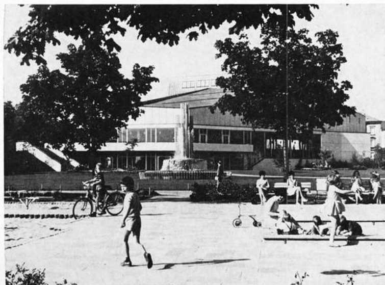
Das 1966 mit der Oper „Die Hochzeit des Figaro“ festlich eröffnete Theater der Stadt Schweinfurt.