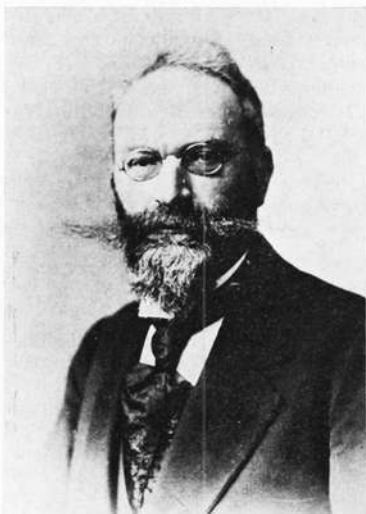
Obering. F. Hefner-Alteneck

Dynamomaschine mit Trommelanker von Hefner-Alteneck. Versuchsmaschine 1872