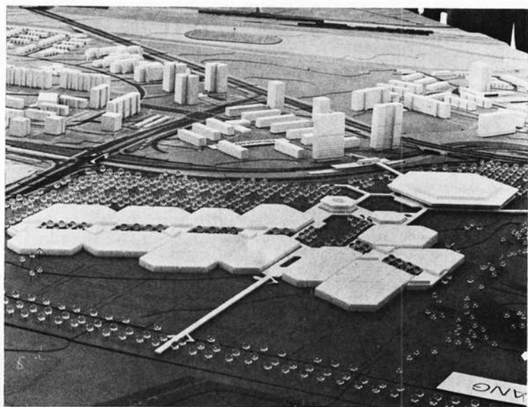
Neues Messezentrum, eröffnet im Januar 1973

Man schrieb diesen Gang der Dinge den hohen Preissteigerungsraten (8-10 Prozent) zu, aber auch dem Umstand, daß die Enge auf dem Gelände trotz aller findigen Arealerweiterungen immer drangvoller wurde. Ja, man hatte in den letzten Jahren auf dem alten Messegelände noch viel getan, um „Luft“