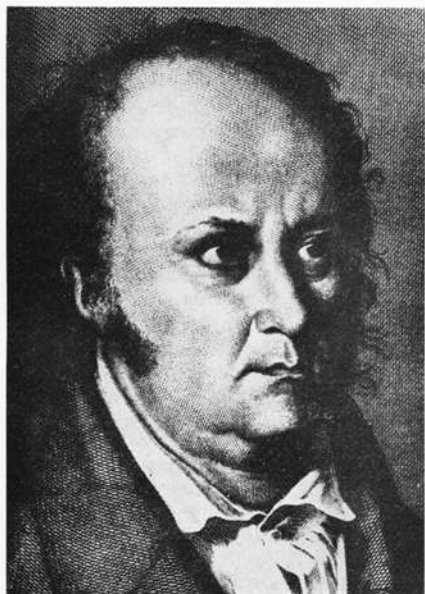
Kupferstich von A. Schlich nach Fr. Meyer. Porträtsammlung der ehemal. Preußischen Staatsbibliothek in Berlin. In: Deutsche Männer. 200 Bildnisse und Lebensbeschreibungen (Berlin 1938). Reproduktionsfoto: Eichel, Schweinfurt.