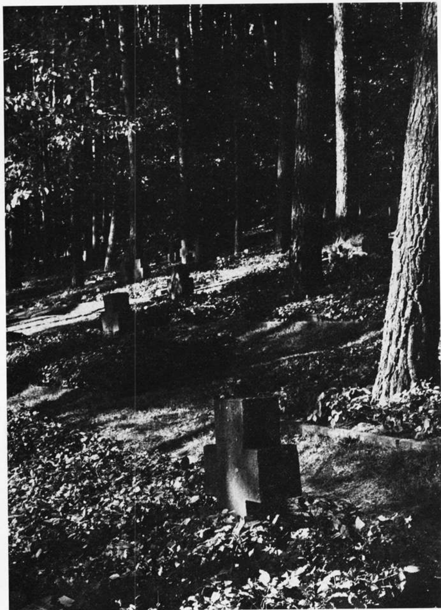
Kriegsgräberstätte Gemünden/Main. Am Einmal.