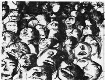
Der Märchenprinz wird erwartet. Tempera/Kohle 1963