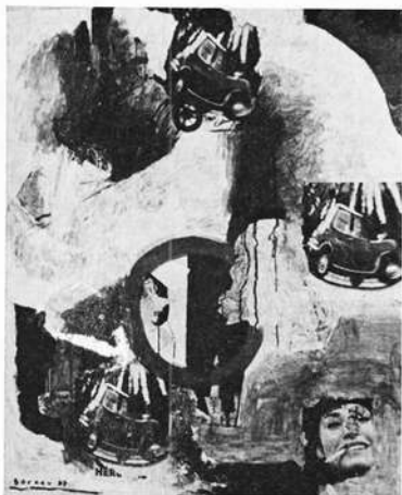
„Schnelle Wagen“, Collage 1967