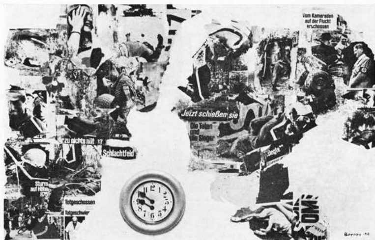
„Krieg“, Collage 1968

im „Armenhaus der westdeutschen Kunst“, wie es der Künstler selbst nennt, wird künstlerische Progressivität oft genug nur auf die Ebene rein formaler Ästhetik verwiesen.