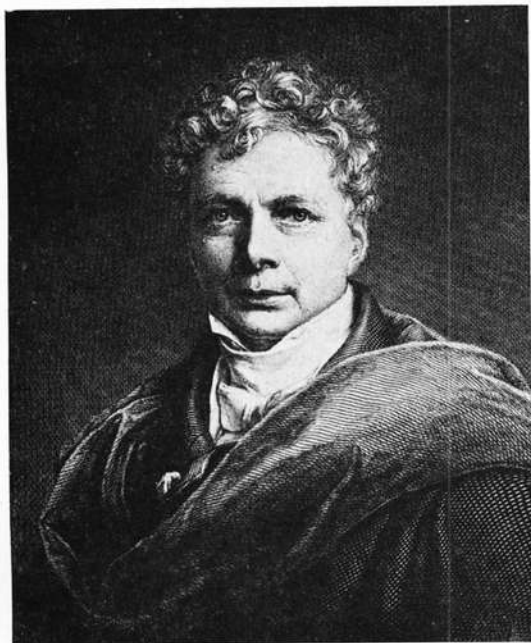
F. W. J. Schelling 1775-1854