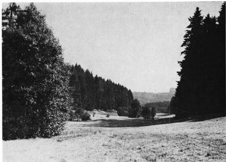
Geplantes Naturschutzgebiet „Thronbachtal“ (westlich Schauenstein).