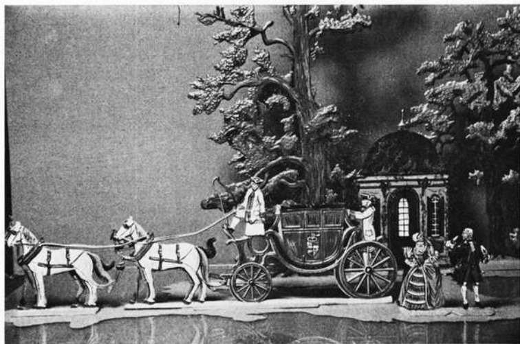
30-mm-Flachfiguren: Ausfahrt mit der Kutsche um 1750 Kutsche aus der Form der Stadt Kulmbach, div. Zubehör.

Nürnberg und Fürth sind bedeutende Marksteine der Zinnfigur, hier hat sie wie in keiner anderen Region unseres Erdenrunds Geschichte gemacht, deren Abbild und historische Vorgänge sie selbst wieder von Franken aus der