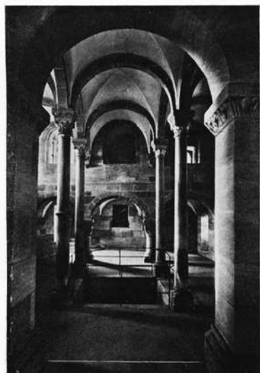
Nürnberg: Kaiserempore in der romanischen Burgkapelle.

Geschichtlich faßbare Berührungen sind, nach den Bewegungen der Völkerwanderungszeit, in karolingischer Zeit erkennbar. Unter Karl dem Großen kommt es zur Gründung der 14 sog. „Slawenkirchen“. Förchheim und Hallstatt am Zufluß der Regnitz in den Main werden zu ersten Austauschplätzen des Handels. Den Auftrag der Missionierung übernimmt nach 1000 in salischer Zeit das von Heinrich II. begründete neue Bistum Bamberg, eine Aufgabe, deren Aktualität im 11. Jahrhundert beispielhaft das einzigartige frühromanische Relief der „Heidentaufe“ in der Johanniskirche von Großbirkach (um 1040), an der alten Hochstraße Würzburg-Bamberg gelegen, bezeugt. Damals dürfte der böhmische Nachbarraum zusehends ins fränkische Bewußtsein gerückt worden sein.