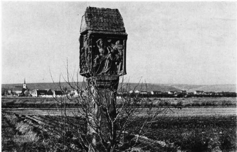
Ein wohlvertrautes Bild für jeden Frankenfreund. Die „Graue Marter“, eines unserer bedeutendsten Bildwerke dieser Gattung, an der Straße nach Gerlachshausen.

Ich brauche hier nicht auf das einzugehen, was die Leser unserer Zeitschrift entweder schon wissen oder leicht nachschlagen können; um so mehr blutet mir das Herz dabei, wenn ich nun in aller Eindringlichkeit von dem berichteten muß, was ich also jüngst gesehen: