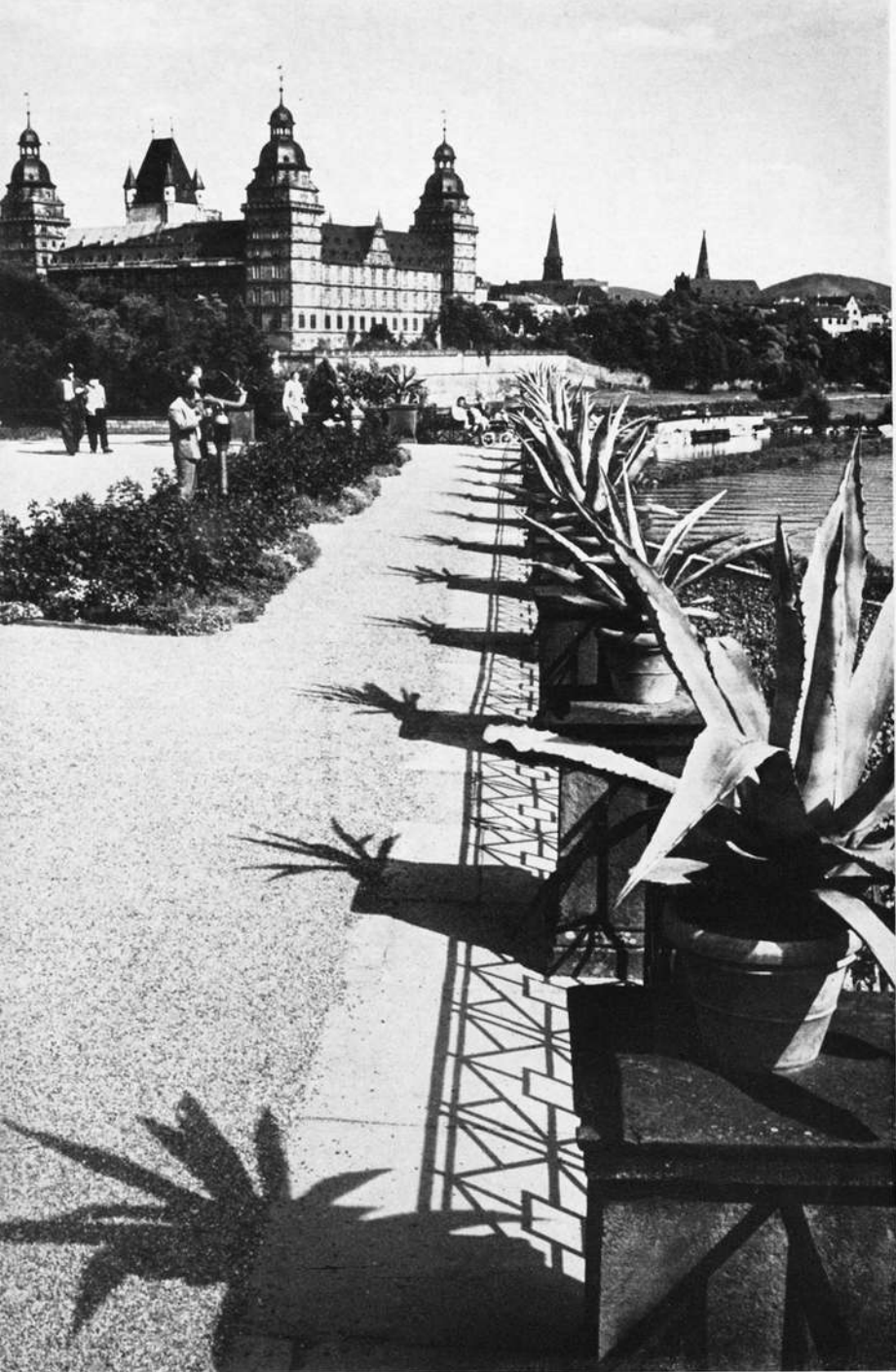
loß Johannisburg zu Aschaffenburg