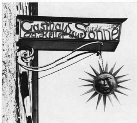
Ausleger „z. Sonne“ in Colmberg