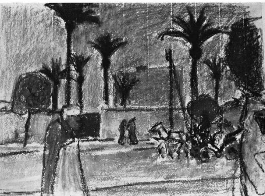
Straße in Marrakesch, Ölkreide 1971

Mit der Übersiedlung ins fränkische Aschaffenburg im Jahre 1949