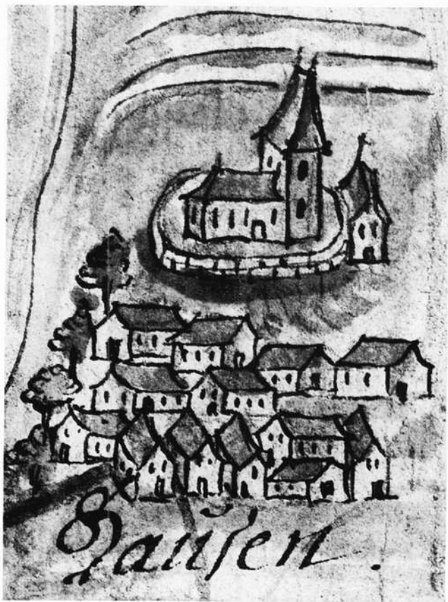
Hausen auf einer hist. Karte, Ausschnitt im Original 4,2 x 5,6 cm

Die Problematik solcher Versuche wird nicht bestritten, manche Einwände sind berechtigt. Aber ohne diese Initiative wären die alten Fotos eines Tages in den Ofen gewandert, die Barocktruhe, die im Freien stand, restlos zerfallen, hätten die Motten die restlichen Krippenfiguren vertilgt, die lieben Kleinen, wie in einem Fall schon geschehen, die handgeschriebenen Gebetbücher als Spielzeug benützt.