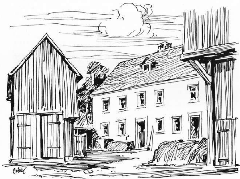
Ehemalige Dorfschmiede, das Geburtshaus von Hans Vogt, in Wurlitz bei Hof/Saale. Zeichnung: Karl Bedal, Hof/S.

Zuletzt aber können wir von diesem „Doctor universalis“ nicht Abschied nehmen, ohne seiner grundsätzlichen Ausrichtung, seinem maßgebenden Grundsatz zu folgen: „Die Geschichte der Vergangenheit ist die Lehrmeisterin für die Zukunft!“. Weil nach dem Worte Haucks „alles Irdische das Ergebnis geschichtlichen Werdens ist“.