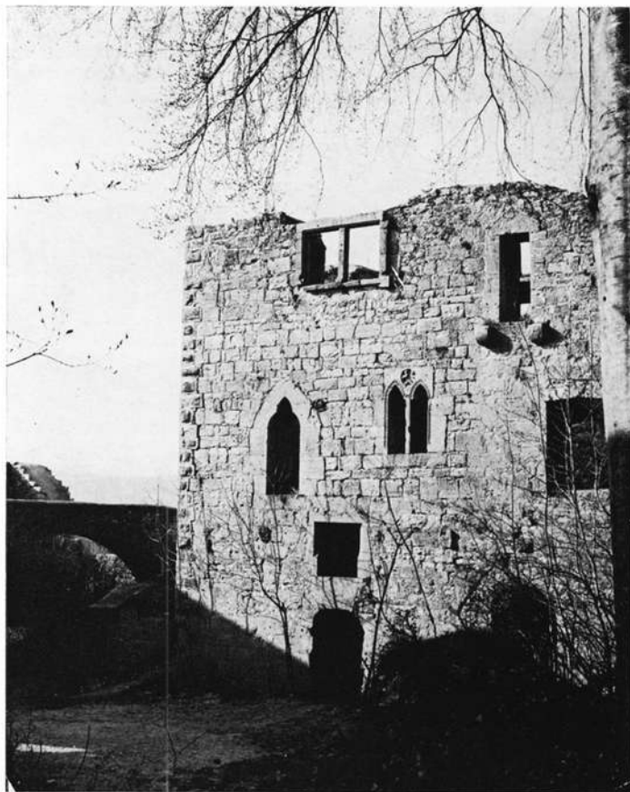
Burg Leofels Wohnbau Hofseite.

Beim Abbruch der Burg Leofels im vorigen Jahrhundert blieben die gesamten Umfassungsmauern erhalten. Die Burg liegt in der für unsere Gegend charakteristischen Weise auf einer Landzunge, die steil in das Flußtal der Jagst und zu einem der Seitentäler abfällt. Der Wasserversorgung wegen liegt die Burg tiefer als die Ebene, was ihre Verteidigung erschwerte. Man schützte sich durch einen tiefen Halsgraben, der die Talhänge verbindet und hinter dem sich in besonderer Mächtigkeit die Schildmauer erhebt. In der südlichen, auf dem steilen Talhang erbauten Mantelmauer ist der Palas mit einem reichen Obergeschoß und einem einfachen Untergeschoß eingebaut; in der nördlichen liegen die Wohngelasse, die Kemmenaten. Der Palas ist nach außen durch Fensterreihen gegliedert, deren Kapitäle reich und mannigfaltig geziert