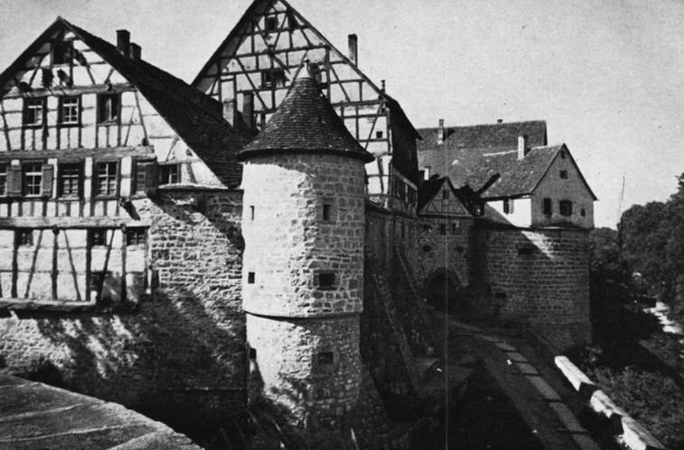
Vellberg. Bürgerhäuser mit Stadtbefestigung.