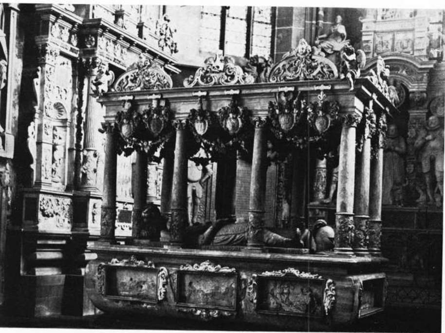
Prunkgrabmal für den Grafen Ludwig II. von Löwenstein-Wertheim, die „Bettlade“, in der Stadtkirche zu Wertheim.

Bauernkrieg, Reformation, Gegenreformation und die sie begleitenden kriegerischen Auseinandersetzungen waren für die neue Kunstrichtung kein günstiges Klima. Auch die große Bautätigkeit des Würzburger Fürstbischofs Julius Echter im „Juliusstil“ sollte mehr Herold des fürstlichen Ansehens und Mittel zur Durchsetzung seiner gegenreformatorischen Ziele sein, als die Kunst fördern. Nur einige Momente schufen gegen Ende des Jahrhunderts die Voraussetzungen für eine Wende, für eine tiefgreifende Neubelebung baulicher und künstlerischer Tätigkeit: in langen Friedenszeiten war der Reichtum in den Reichsstädten und Fürstenhöfen angeschwollen und führte zu den vielfältigsten Unternehmungen, die Gegenreformation und ihre protestantischen