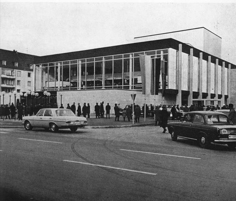
Stadttheater Würzburg. Das neue Haus am Kardinal-Faulhaber-Platz.

Eine glückliche Zeit erlebte das Theater unter Eduard Reimann (1870–1898), der mit einem bürgerlichen Spielplan 28 Jahre lang den Betrieb durch alle Fährnisse steuerte. Die zweite Ära Reimann unter Otto Reimann (1906