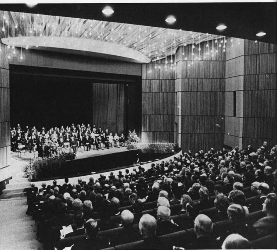
Stadttheater Würzburg, feierliche Eröffnung am 4. Dezember 1966. Es spricht Ministerpräsident Dr. Alfons Goppel.

In diesen Wochen fiel auch die letzte Entscheidung, die zur Vorbereitung des Baubeginns notwendig war: Die über die Ausschreibung eines Wettbewerbs. Teilnahmeberechtigt waren alle in Unterfranken geborenen oder dort mindestens seit 1. Juni 1957 ansässigen, freischaffenden, beamteten oder angestellten Architekten. Außerdem wurde es für richtig gehalten, einige bekannte Theaterbauer namentlich zur Teilnahme am Wettbewerb einzuladen, deren Bauten der Kulturausschuß auf einer Theaterbesichtigungsfahrt gesehen hatte. Der Wettbewerb brachte interessante Vorschläge und Lösungen, die in einer Ausstellung der Öffentlichkeit zugänglich gemacht wurden. Am 13.