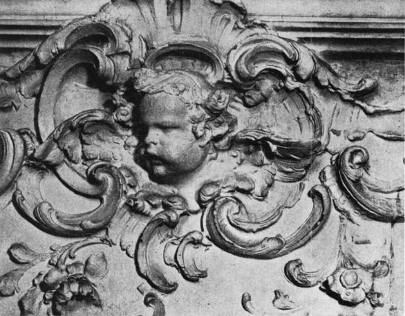
Neumann an seiner Entstehung mit. Die reiche Stuckdekoration dürfte von einem in Würzburg geschulten Meister stammen, ihrer noblen Ornamentik nach zu schließen. Oswald Schäfer

merkt er zuerst, daß die Gesamthöhe des Gerberhauses zur Breite im goldenen Verhältnis steht, ein Verhältnis, das in mannigfachen Abwandlungen an dem Haus immer wieder auftritt und auch reinweg wiederkehrt, zum Beispiel bei der Höhe und der Breite im Giebeldreieck, genauso bei der Höhe und der Breite des bloßen Mauerwerkes, nicht minder bei den Fenstermaßen und in den Abständen der parallelen, waagrechten Balkenlager im Fachwerk, die nach oben hin in abnehmendem Maße verlegt sind. Die Höhen und Breiten verhalten sich überall wie Minor und Major im Goldenen Schnitt. Nur ein kleiner Teil des Fachwerkes am Gerberhaus ist anders proportioniert und verrät dadurch seinen eigenen Geschichtsverlauf.