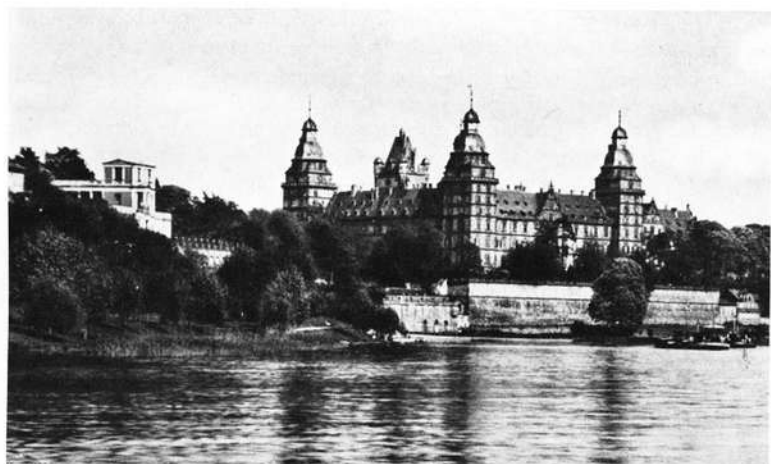
Aschaffenburg, Schloß und Pompejanum