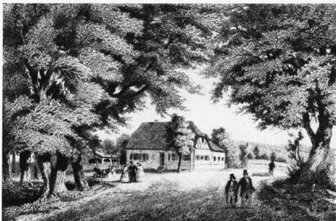
Die Rollwenzlei bei Bayreuth

1825 ansässig bleibt. Wenn er nicht, wie er es besonders im letzten Lebensjahrzehnt immer mehr liebt, auf Reisen ist, verbringt er dort seine langen Arbeitstage in einem kleinen Gasthaus vor den Toren der Stadt, in dem er sich ein Arbeitszimmer, zusätzlich zu seiner Stadtwohnung, gemietet hatte: in der berühmten, nach der Wirtin so benannten „Rollwenzlei“.