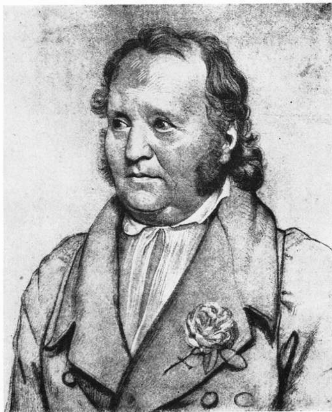
Jean Paul im 60. Lebensjahr - Zeichnung von Vogel von Vogelstein (1822)

Welt nicht, und wenn ihm Schiller vorwarf, er gebrauchte, um „die Dinge außer sich zu sehen“, leider das falsche Organ, dann berührte auch dieser Vorwurf nicht den Kern seines besonderen Künstlertums: das Reich, in dem er lebte und mit ungeheuer scharfen und tiefdringenden Augen zu schauen vermochte, war das Reich der Innerlichkeit, der Wunder und Rätsel der Seele. Zur Entwicklung und Bildung des Sinnes, mit dessen Hilfe er sich in dieser inneren Welt orientieren konnte, bedurfte er nicht der Weltstadt London, dazu waren die kleinen Orte in der Markgrafschaft Bayreuth, in denen er seine Kindheit und frühe Jugend verbrachte, groß und reich genug. Ja die Enge, die Dürf-