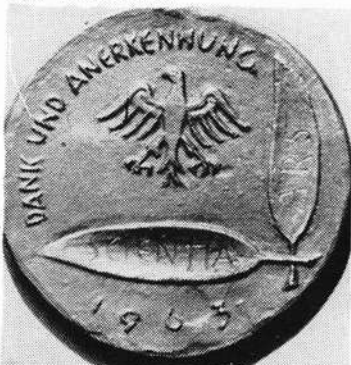
Heinrich Söller (Schweinfurt)