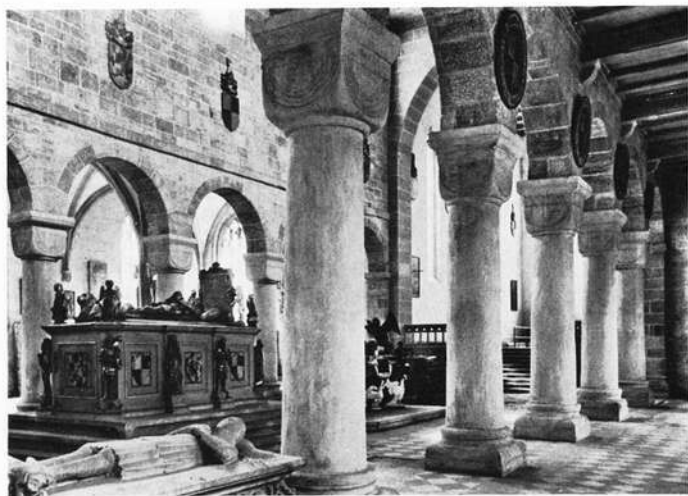
Heilsbrunn, Münster, Hochromanisches Langhaus mit Hohenzollerngräbern