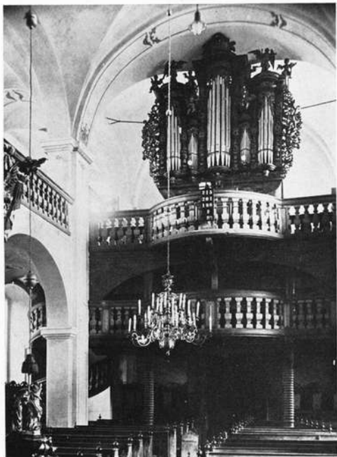
Wilhelmsdorf, Hohenlohekirche, Innenraum, Blick zur Orgelempore.