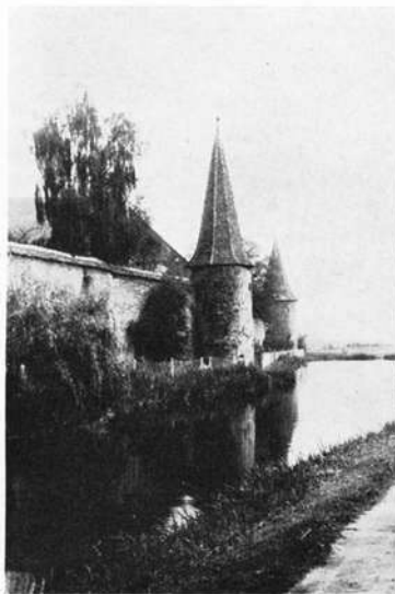
Merkendorf. Wasserbefestigung mit Rundtürmen