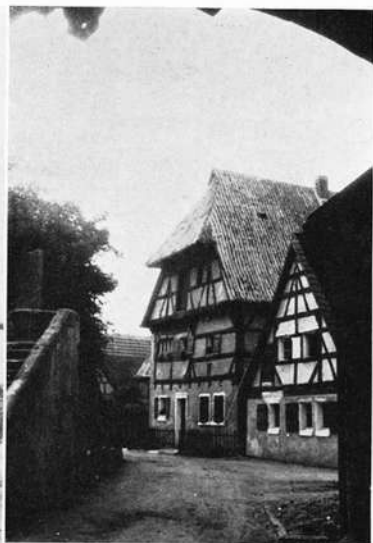
Wolframseschenbach. Pfändnerhaus (Spätgotisch)