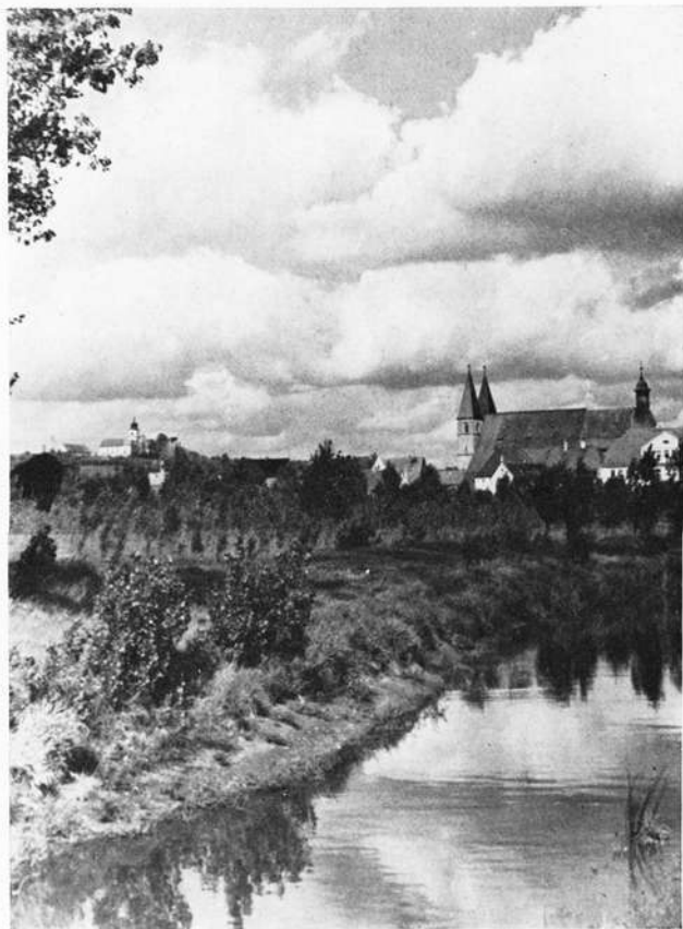
Herrieden. Stadtbild mit Stiftskirche

gründete. Für diese Vorstöße gegen Regensburg bedurfte es eines entsprechenden Hinterlandes, was eine 3. Welle staatlicher Siedlungstätigkeit bedeutete, die wiederum sowohl Kolonisation wie Organisation war. Durch die Ansiedlung von wehrhaften Königsfreien, den „unfreien Freien“ (Bosl), im Gauland, vor allem aber in den ausgedehnten Königsbannforsten des Keupers wird neues Königsgut geschaffen. Von zwei Seiten her sind die großen, schwach besiedelten Keuperwälder erschlossen worden: einmal vom Westen, aus dem völlig verfrankten Altsiedelland, entlang den Nebenbächen der Aisch, den Quellbächen der Zenn und fränkischen Rezat und zum anderen vom Osten her, von der zweifachen Königshoflinie in der Regnitzfurche (Hallstadt — Eggolsheim — Forchheim — Büchenbach — Fürth — Schwabach