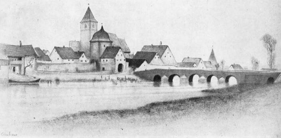
Ornbau. Stadtbild: Südfront mit Altmühltor und -Brücke, und Pfarrkirche – Hermann Gradl, FRANKENLAND-Archiv

und Herzogenaurach — Langenzenn — Roßtal). In lichten Ketten dringen die -dorf-, -bach- und -ach-Namen die vielen Paralleltäler aufwärts und kennzeichnen die vielen „Urdörfer“, die oftmals nur Weiler um einen Fronhof waren. Diese zunehmende siedlerische Auffüllung der Keuperwälder, die zu mehr oder weniger großen Rodungsinseln in dem umfangreichen Waldgebiet führte, wird von E. von Guttenberg als eine Art zweiter Landnahme großen Stils bezeichnet. Neben Ansbach im Vircunnia-Wald und dem 776 erwähnten Zennhofen-Neuhof gelangt vor allem Markt Erlbach als Stützpunkt und Sicherung der vielen Verbindungsstraßen zu besonderer Bedeutung.