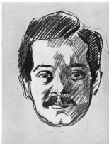
„Heinebildnis“ nach einer Zeichnung von Max Kautschke