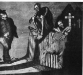
„Abgang im Fieberland“ nach einer Zeichnung von Christian Hermann