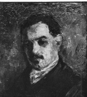
„Bildnis Max Buchenau“ nach einem Gemälde von Karlmann Buchenau