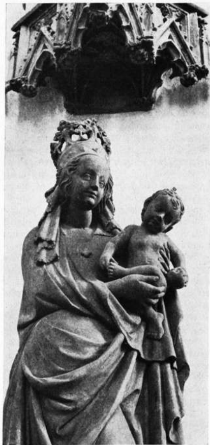
Maria mit Kind, von einem unbekanntem Meister um 1440

seine Darstellung von einem Naturalismus erfüllt, dem der fast zum Symbol erstarrte Vorgang ergreifendes Erlebnis wird; es ist wie ein früher Vorklang Grünewalds, der dieses persönliche Erleben des überkommenen Motivs in das Ungeheure steigert. Mit dem Fortschreiten der Kirche schuf dann diese Bauhütte um 1420 jene drei Tympana der Portale, die Marienkrönung, Letztes Gericht und — ikonographisch besonders interessant — die Verkündigung darstellend, weit über Würzburg hinaus, bis an die Grenzen des Bistums ihren schulbildenden Einfluß erwiesen. Gegen Mitte des Jahrhunderts ward das Langhaus vollendet und eben in jenen Jahren bewährte sich die