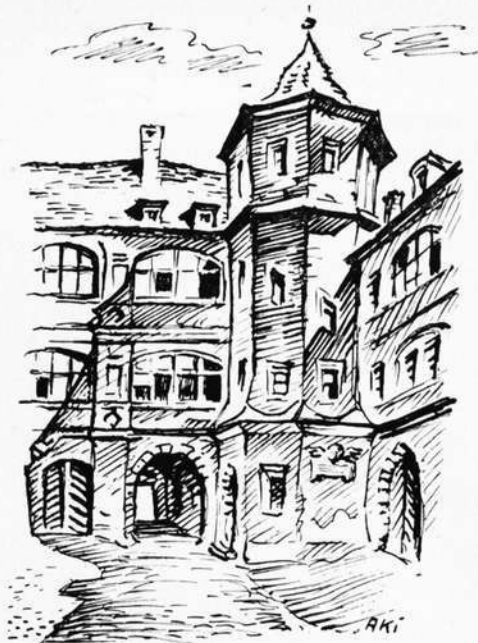
Ansbach — Im früheren Klosterhof

schränkung des architektonischen Bildes der Stadt, dessen Wirkung auf den empfänglichen Beschauer gerade auf die Vielfalt seiner Erscheinungsformen und auf deren polare Spannung zurückgeht.