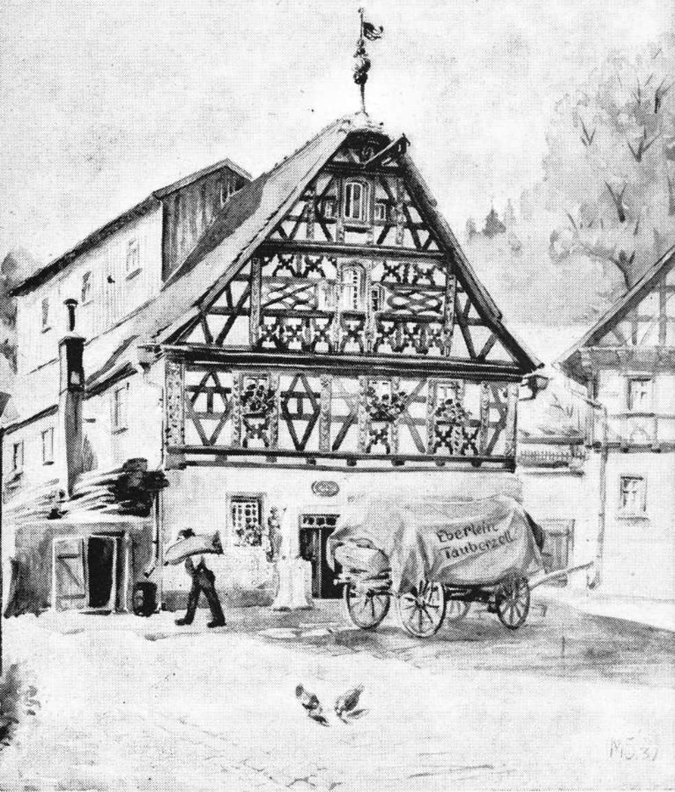
Die Hautschenmühle in Tauberzell