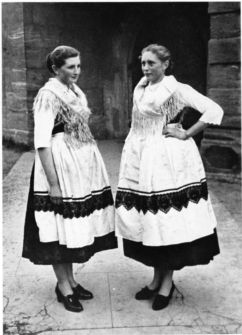
Vor der Kirchenburg in Effeltrich (Lkr. Forchheim)