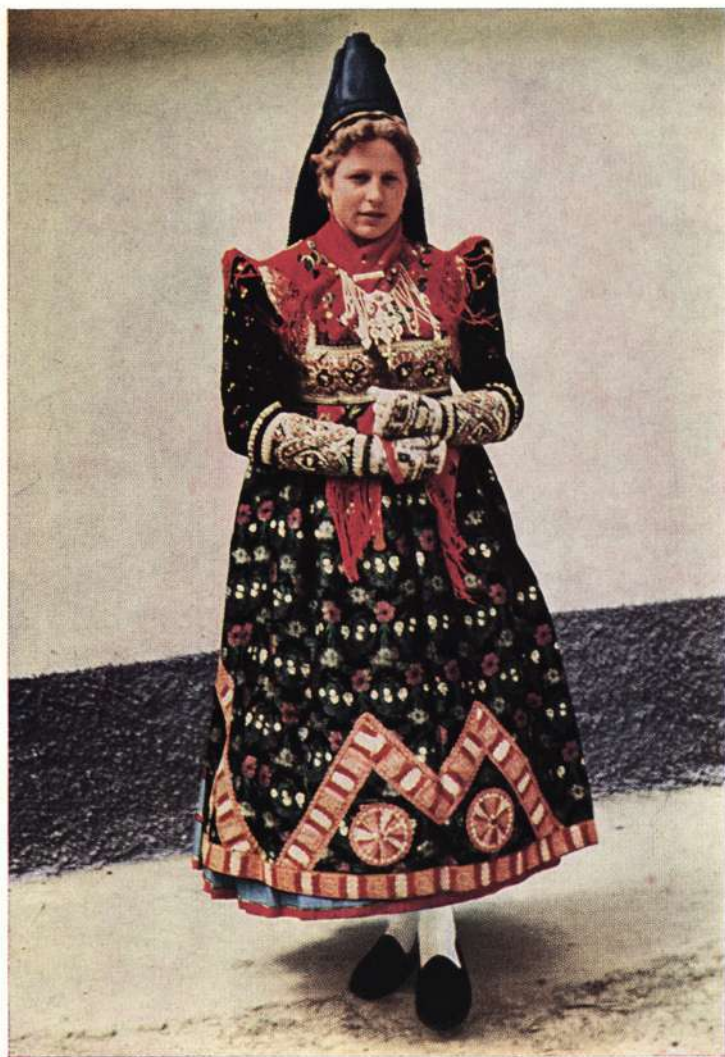
Ochsenufer Gau