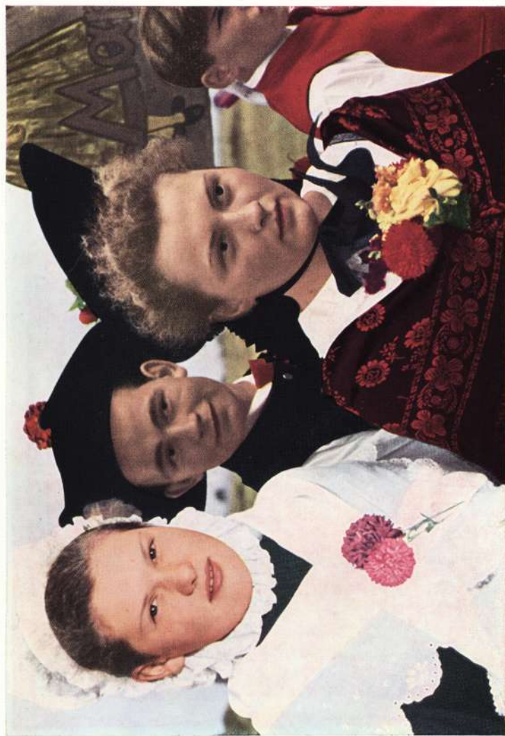
Markteinersheim (Lkr. Scheinfeld)