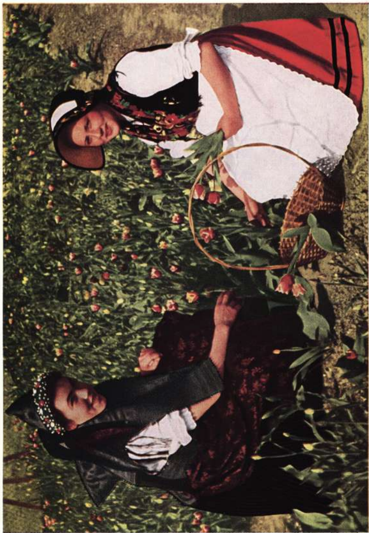
Sennfelder Gärtnerinnen (Lkr. Schweinfurt)