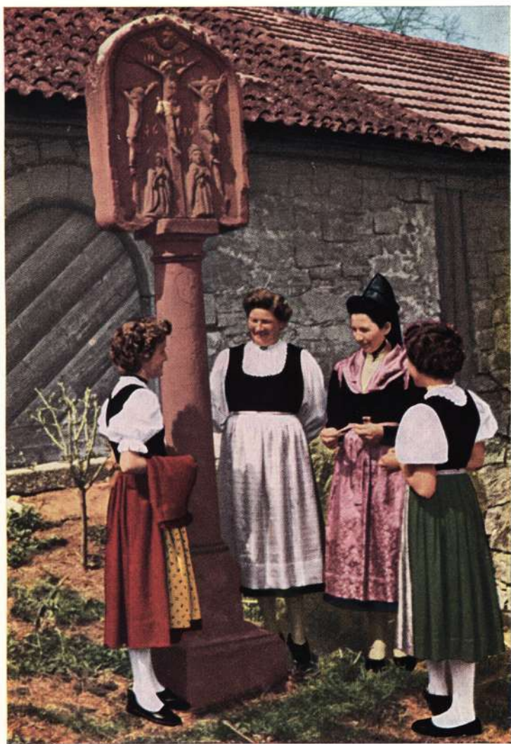
Erneuerte Tracht in Aschfeld (Lkr. Karlstadt)