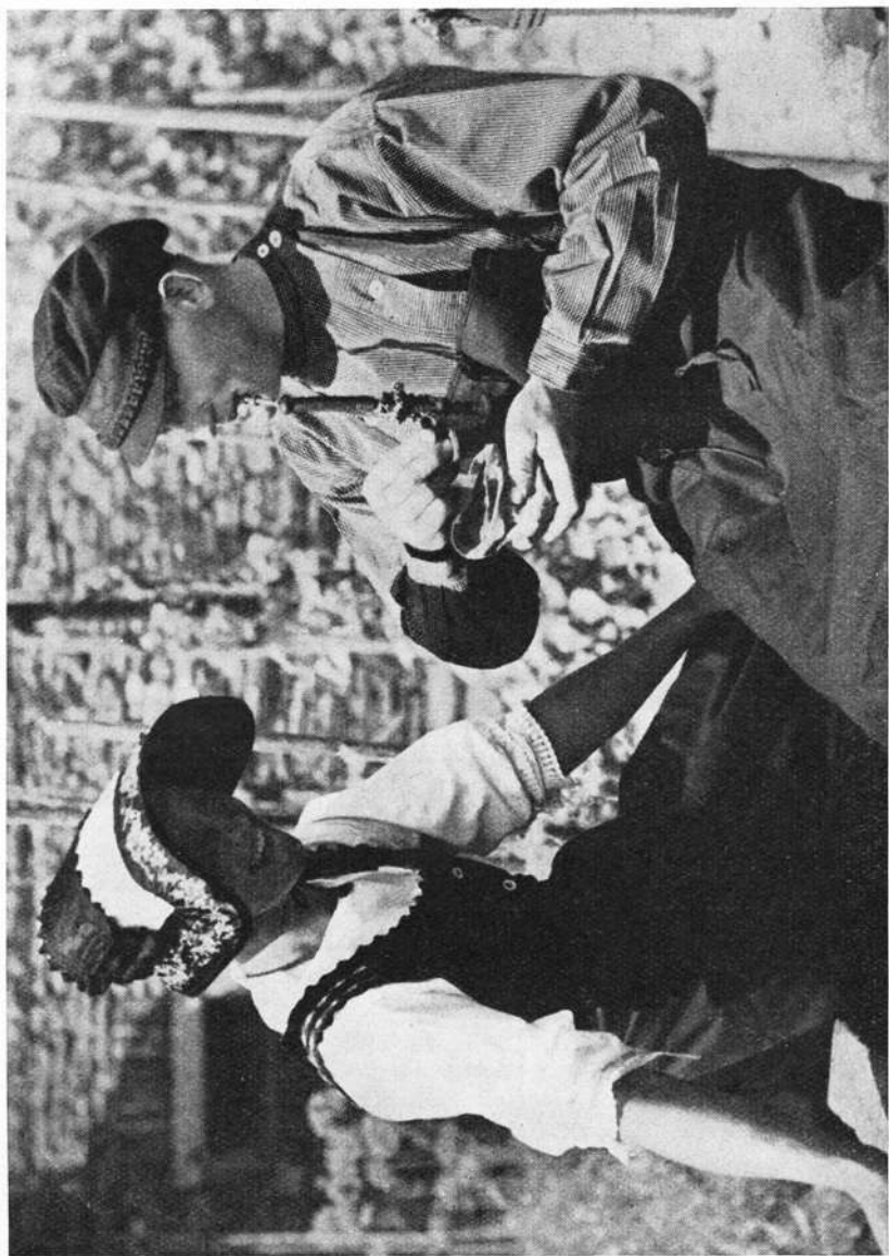
Schweinfurter Gau: Die kleidsame Tracht der Gemüsegärtner von Sennfeld (Lkr. Schweinfurt)