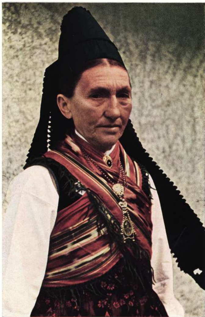
Haselbacher (Rhön)