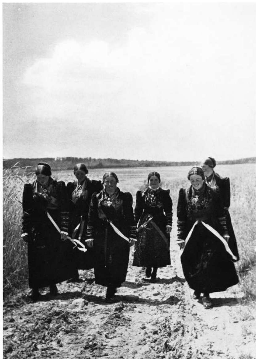
Gauschach bei Hammelburg: Sonntag-Nachmittagsausflug