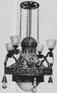
Gios Kaspar, Würzburg. — Entwurf: Rüdert Otto, Mainz