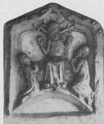
Relief in der Vorhalle