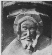
Christuskopf an der Südseite der Kirche

Wiesentauische und Redwitzische Wappen. Im Hauptfeld knien vor dem von Engelsköpfen umgebenen Kruzifix links