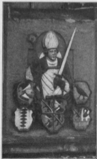
Brustbild des hl. Kilian am Turm (Nordseite)

der Ritter und rechts seine Gattin. Zwischen beiden liegt ein Löwe. Das Hauptfeld ist zu beiden Seiten von je 8 Wappen eingefasst, über denen die Namen der Geschlechter stehen. Das Grabmal zeigt perspektivisch bemerkenswerten Hintergrund. Die Grabschriften lauten: