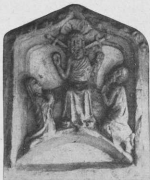
Relief in der Vorhalle