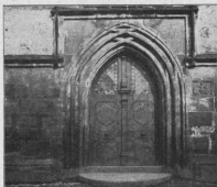
Portal der Westseite

Nicht bloß im 15. und 16. Jahrhundert wurde an der Kirche gebaut, auch später unmittelbar nach dem dreißigjährigen Krieg wurde wieder erneuert, was die zerstörende Hand der Schweden truppen in Trümmer und Brand gelegt hatte. Wir wissen aus urkundlichen Belegen, daß die Schweden 1633 die Stadt Scheshlig zum großen Teil niederbrannten. „Auch Scheshles ist damals hinweg gebrennt worden“ (Friedrich Karl Hümmel, Bamberg im Schwedenkriege. [Bericht des Histor. Vereins Bamberg 1890] S. 118). Ein im Kreisarchiv Bamberg vorhandener urkundlicher Auszug erwähnt ausdrücklich die Verwüstung der Pfarrkirche weil sie (nämlich