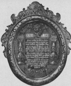
Hugob Operl, Eisenplastik im Wappenstein der Würzburger Ratskeller