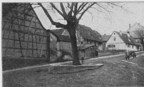
Baum im Dorfe Oberwerra (Bez. v. Schweinfurt)

deutscher Begeisterung und würdig des Dankes an unsere edlen Streiter. Es wäre ein Feuer, das nach alter Volkssitte als Dank für die abgewendete Kriegsnot zum