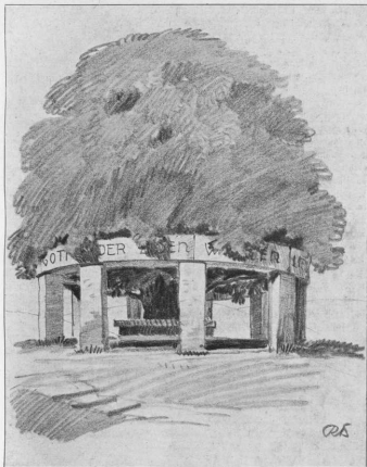
Steinfranz um eine alte Linde (Entwurf von Prof. Rich. Seitz, München)

in diesem Fall der Unterschied zur Umgebung durch einen Naturzaun stärker betont, oder auch was die Berliner Arbeitsgemeinschaft vorschlägt, durch Wall und Graben ein charakteristischer Abschluß gefunden werden. So verschieden- und eigenartig solche Bäume und Baumgruppen in der Landschaft zu finden sind, ebenso verschieden- und eigenartig wird die Art der Ausführung des Erinnerungszeichens sein und