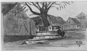
Baum im Dorfe Oberwerra als Helden Denkmal (Stiftung von R. Bredt)

Himmel loderte 1) . An die segnende und heilende Wirkung des Feuers 2) wäre damit in besonderer Weise erinnert. Alte deutsche Sitte und Art würde so