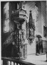
Die Kanzel in der Wallfahrtskirche.